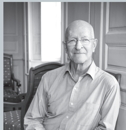
Claude Nicollier dans la salle d'histoire, mars 2021

🌙 15 déc L'actualité du livre animé par Pascale Frey mercredi 18 h 30 - 20 h 00